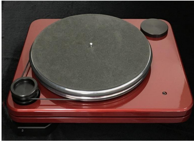
Robin Hood SE アームレス