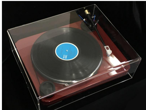
専用ダストカバー Robin Hood Dust Cover 装着時