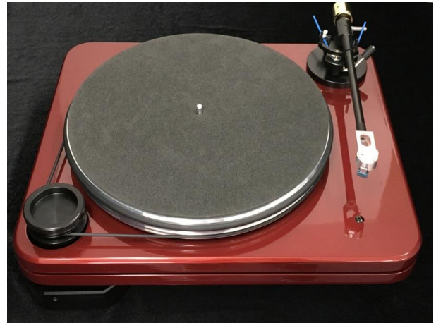
Robin Hood SE Cornet 1 トーンアーム付 ※カートリッジは付属しません。